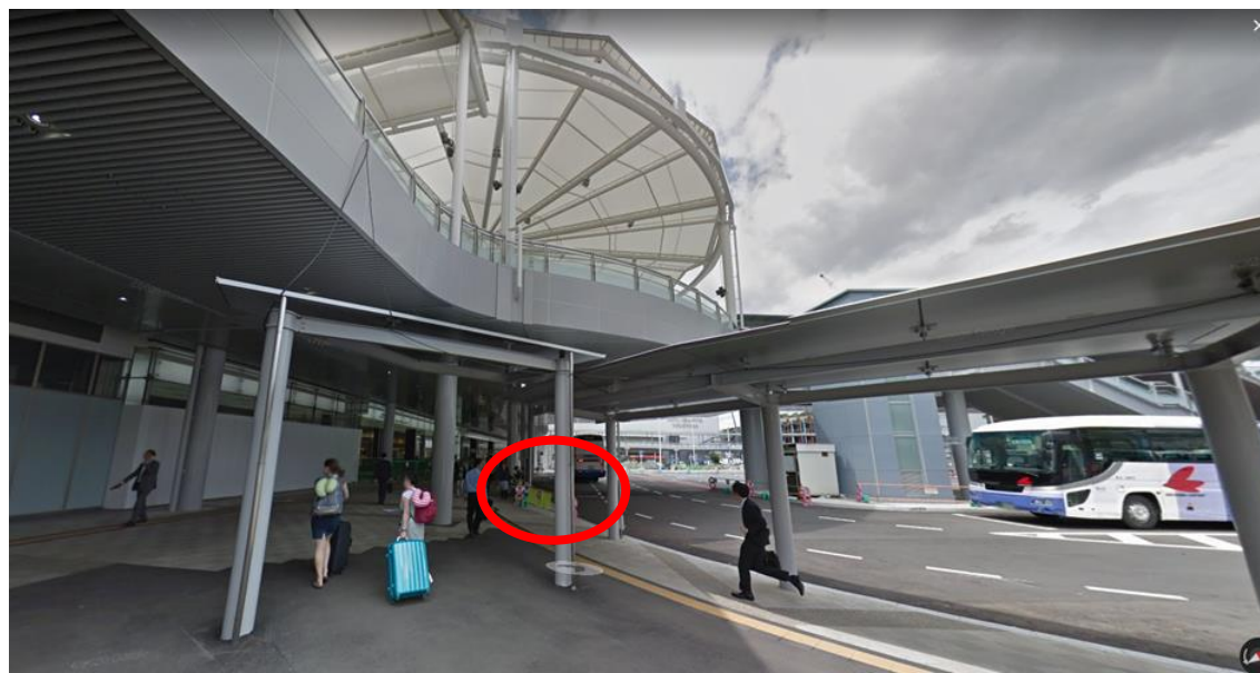
北口の1階駅の出口付近で待ち合わせ